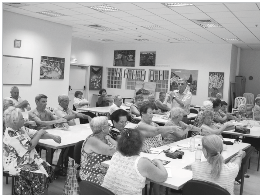
Занятие в Школе здоровья