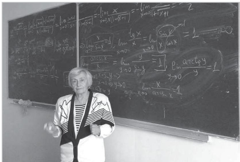
На последней лекции в ГУАП

Теперь наш ВУЗ называется ГУАП (Государственный университет аэрокосмического приборостроения). Некоторое время преподавала высшую математику ещё и студентам Иерусалимского университета, которые 2 года учились в Ленинграде, а третий и четвёртый курсы заканчивали уже в Израиле.